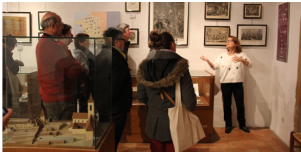
Musée Jeanne d'Albret d'Orthez