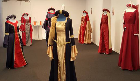
Un dressing à la cour d'Orthez

de Navarrenx proposé par les associations du CHAR, Place Forte et Zoom 64.