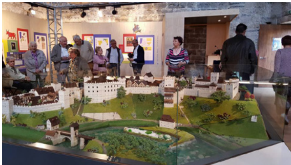
La tour Montréal