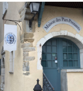
Visite guidée de la Maison des parts-prenants