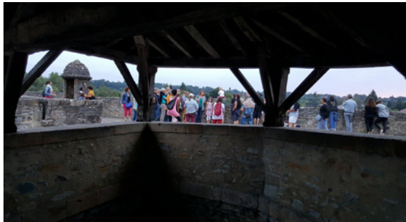
Découverte des remparts de Navarrenx